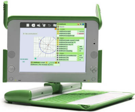
Etoys et DrGeo sur un OLPC

Gestion de la persistance : base de données objets (Magma, GemStone), relationnelles (MySQL, PostgreSQL), mapping objet relationnel (Glorp...).